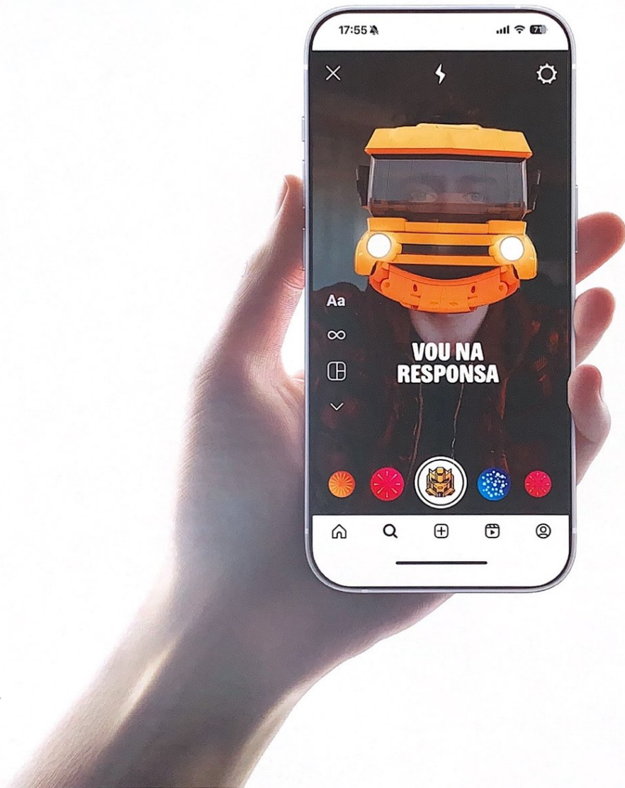
12. Filtro Instagram 1080x1920px - "Vou na Resposta"