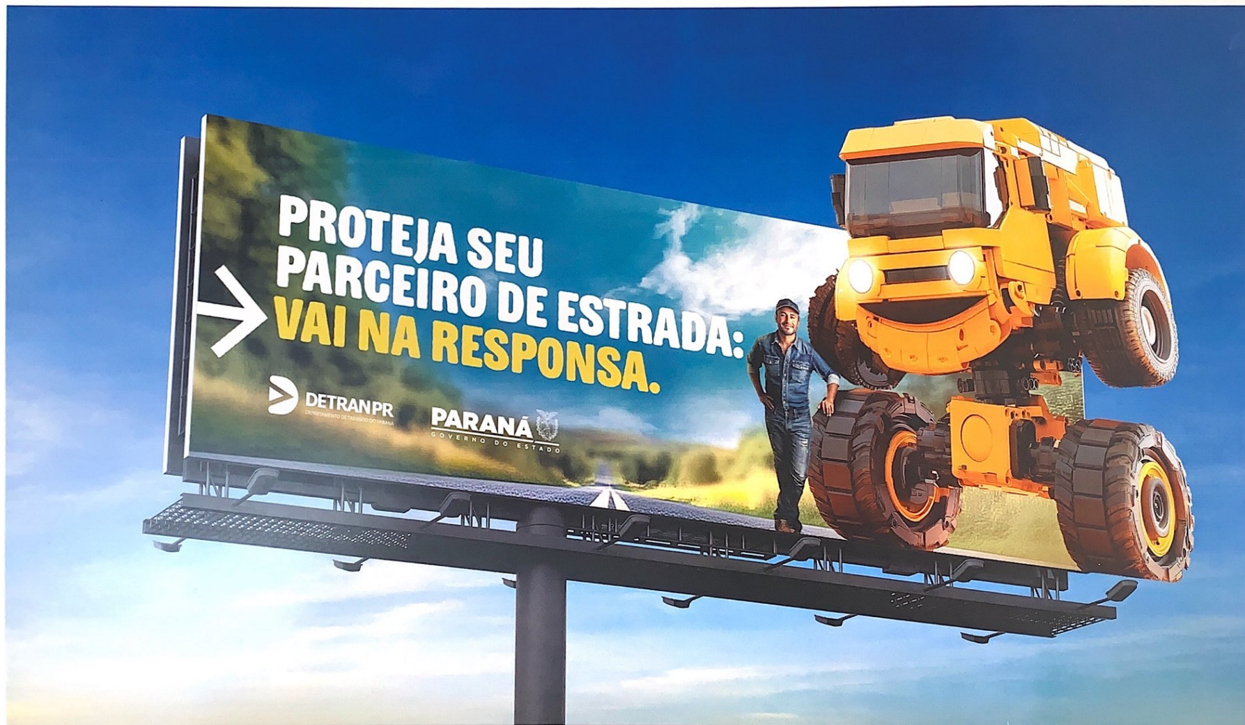
6. Painel rodoviário com aplique 10,3x4,5m - "Proteja seu Parceiro"

Handwritten marks: a checkmark and a stylized signature.